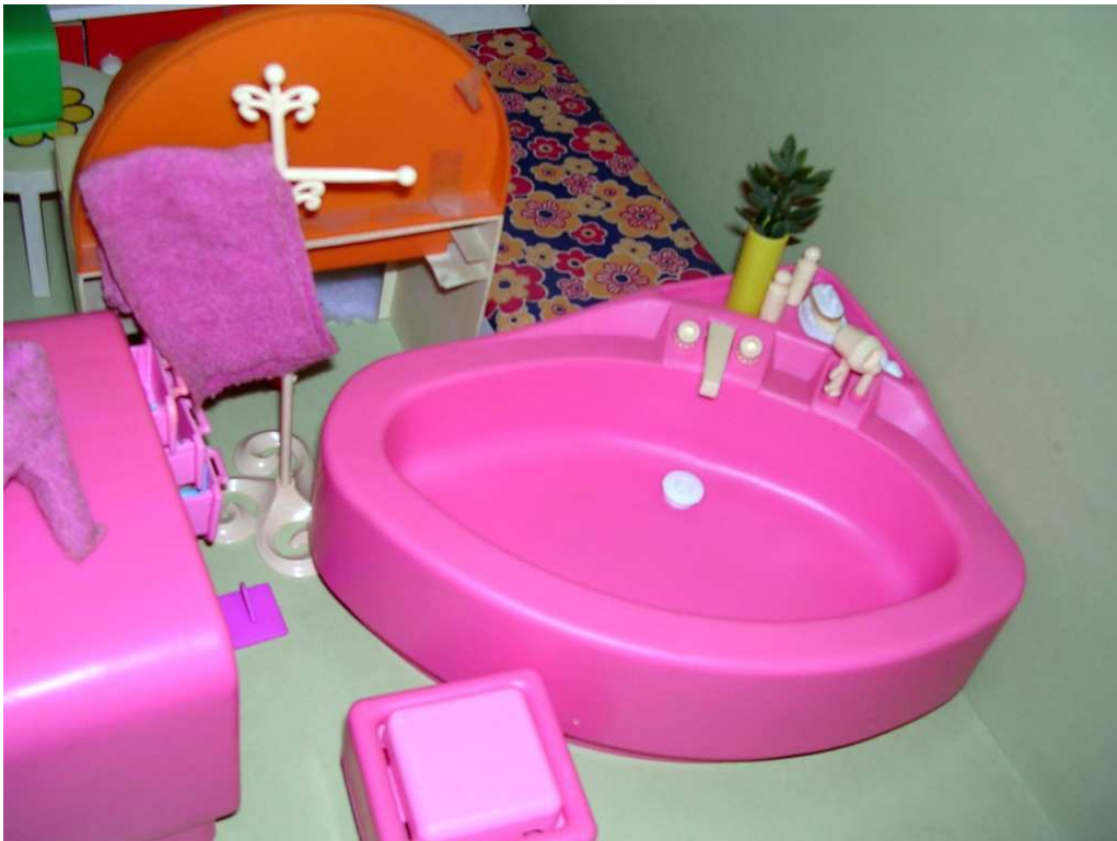
Vasca e toilette anni '70