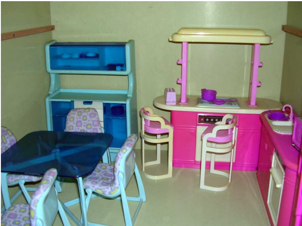
Soggiorno e cucina anni '70