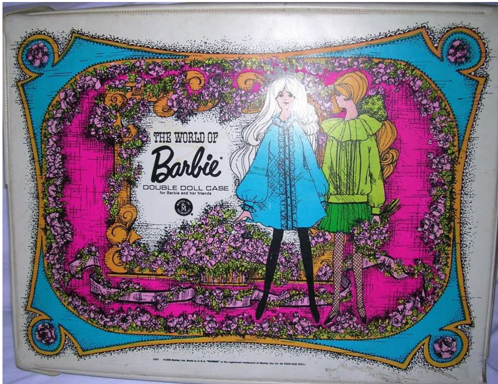
Porta bambola 1968