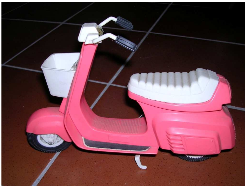
Vespa anni '80