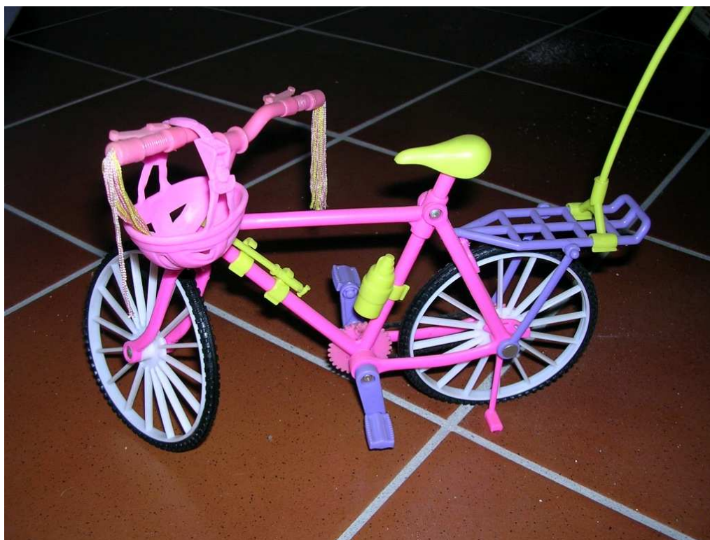
Bicicletta fine anni '80